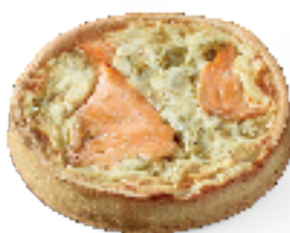
Witloof en gerookte zalm