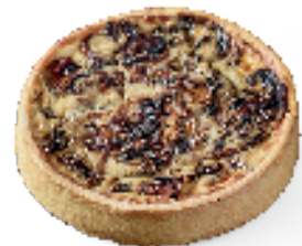
Champignons met spekjes