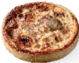
Verse geitenkaas, druiven en pepermunt

----- Meer dan 30 recepten voor lekkere quiches en hartige taarten -----