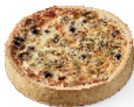
Duo van olijven en gedroogde tomaten met fetakaas