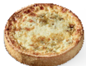
Gratin van witloof en ham