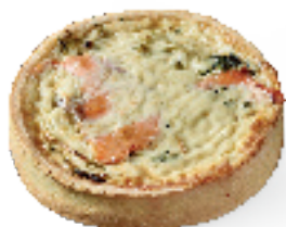
Zalm met broccoli