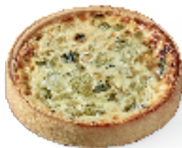
Roquefort en selders