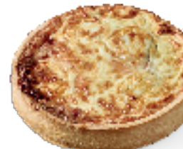
Geitenkaas en gerookte zalm