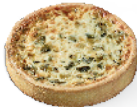
4 kleine groenten met tijm

Ons ruime en gevarieerde aanbod aan quiches