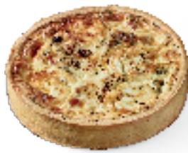
Verse geitenkaas, gegrild spek met honing en tijm