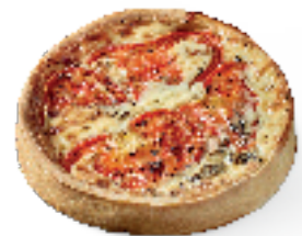
Tonijn, tomaten en basilicum

----- Meer dan 30 recepten voor lekkere quiches en hartige taarten -----