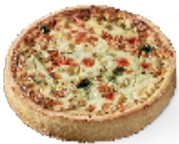
Kip, courgette, tomaat en oregano