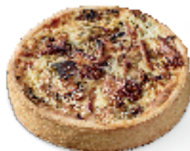
Boschampignons bestrooid met peterselie