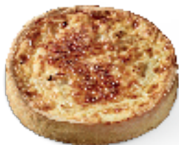
Gratin van bloemkool en ham