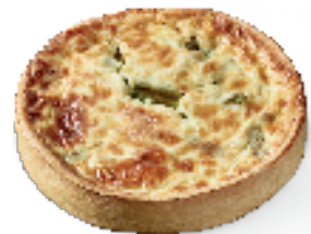
Asperges met ham