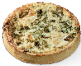
Verse geitenkaas met waterkers