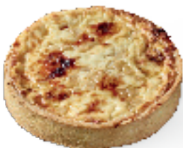
Herve-kaas en peren

----- Een deeg met pure boter, een romige bereiding en geen bewaarmiddelen -----