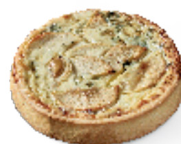
Roquefort en appels