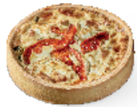
Verse geitenkaas, prei, tomaten en rozemarijn